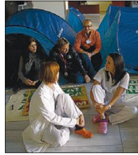
► Tancada al Sant Pau, ahir.

El CatSalut i la Conselleria d'Economia van comunicar a principis d'aquesta setmana el nou impagament a la xarxa concertada, que s'agrupa en les patronals Unió Catalana d'Hospitals , Consorci de Salut i