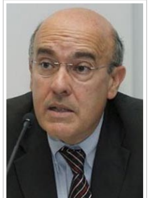
Boi Ruiz, consejero de Salud de Cataluña.

Por otro lado, según informa Europa Press, este impago de parte de la factura no afectará a los geriátricos, residencias y centros de día que paga el Instituto Catalán de Servicios Sociales (Icass), a los que la Generalitat se había propuesto buscar una solución para pagarles la mayor parte del retraso del pasado julio antes de final de año.