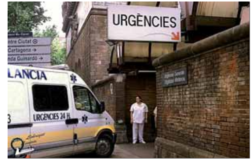
L'hospital de Sant Pau és un dels concertats que resultaran afectats per l'impagament de la Generalitat

pis de setmana a les patronals La Unió , Associació Catalana d'Entitats de Salut i Consorci de la Salut i Social de Catalunya. ■