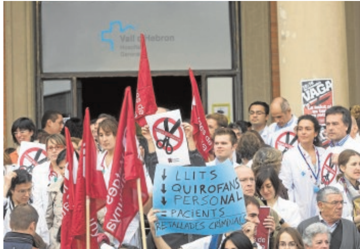
Trabajadores del Vall d'Hebron durante las protestas de 2011

Por otro lado, el sector sanitario concertado catalán reconoció ayer que no ha recibido todavía el 40% de la factura pendiente del mes de noviembre que debían recibir a partir de este lunes, según informaron a Ep fuentes de la patronal Consorci de la Salut i So-