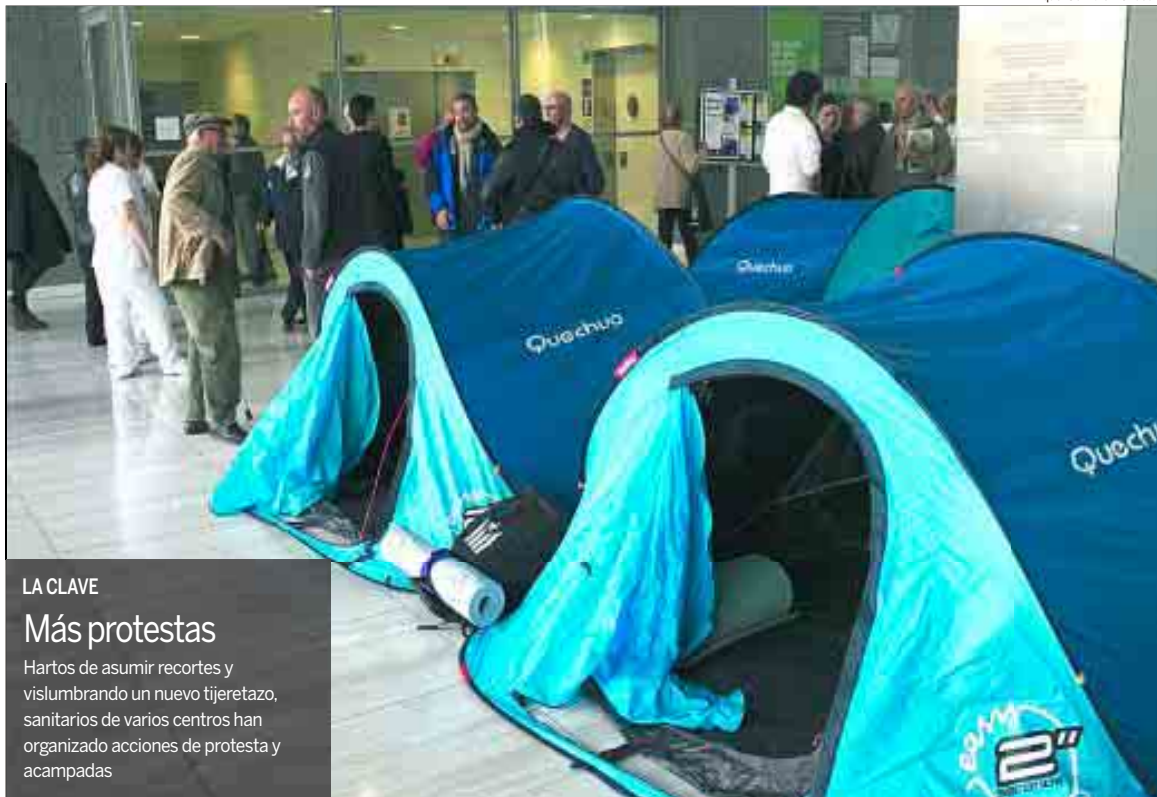
Los empleados del hospital de Sant Pau llevan acampados desde el 28 de noviembre